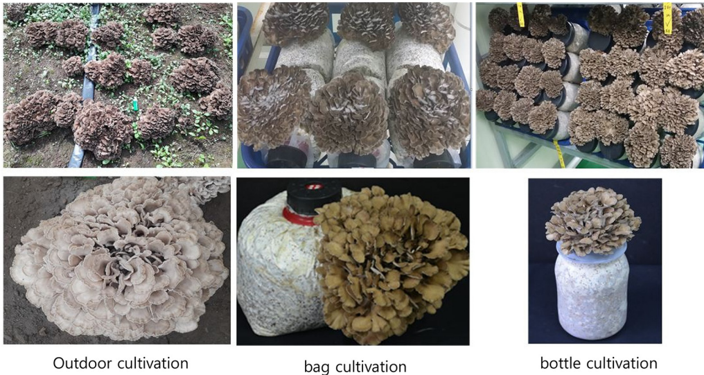
Fig. 1. Maitake mushrooms ( Grifola frondosa ) appearances of cultivated by three different methods

내 18°C에서 각각 배지에 접종하여 다 자란 20일 후에 수확하였다. 봉지재배는 내열성 PE 비닐을 사용하였고, 병재배는 1,100 mL의 내열성 플라스틱을 사용하였다. 채취한 시료는 동결건조기(PVTFD20R, Ilshin Lab. Co., Seoul, Korea)를 사용하여 건조시켜 200 mesh로 분말하여 -70°C에 보관하면서 사용하였다. 동결건조한 분말 상태의 잎새버섯의 열수 추출물은 건조된 잔사에 10배량의 증류수를 가하여 90°C에서 6시간씩 3회 반복 추출하여 취하였다. 상층액은 여과지로 여과한 후 rotary evaporator (N-1000, Eyela Co., Tokyo, Japan)로 60°C에서 농축하고 37°C에서 건조하였다. 건조된 시료는 -20°C에서 보관하면서 실험에 사용하였다.