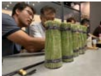
홍콩 기호도 조사(한인홍)