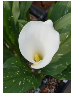
【화포 내 육수화서】