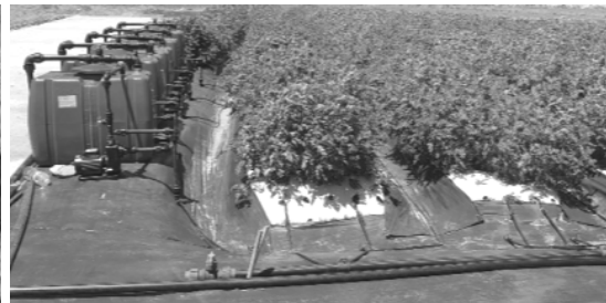
【 점적관수시설을 통한 A11 처리 】