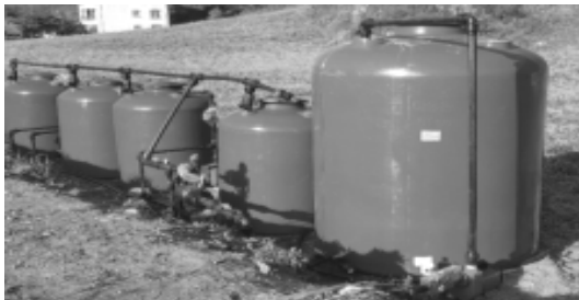
【 기존 농가 관수장비 활용 가능 】