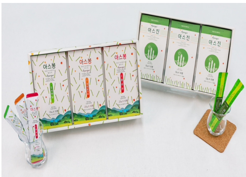
【아스파라거스 가공품(아스봉, 아스진)】