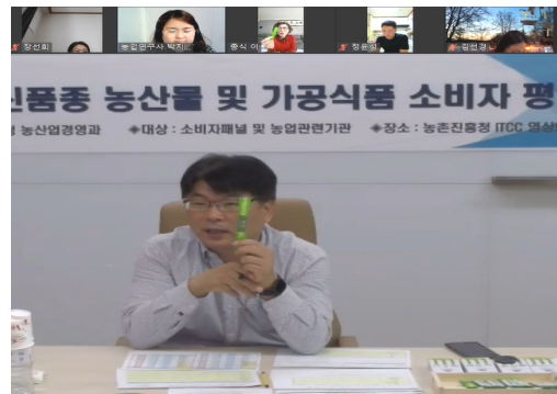
【소비자패널 비대면 온라인 평가】