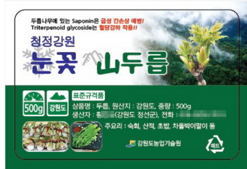
【500g 소포장팩 홍보 스티커】