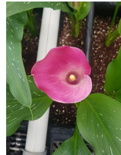
[화포 내 육수화서]