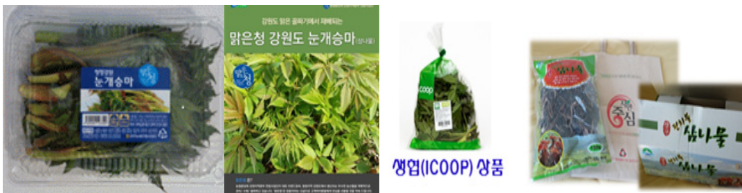
[농협 소포장 유통상품 브랜드 및 선도농가 유통판매 제품 포장형태]