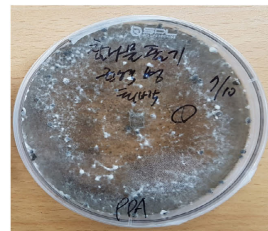
[병징 및 병원균( Sclerotinia sclerotiorum )]