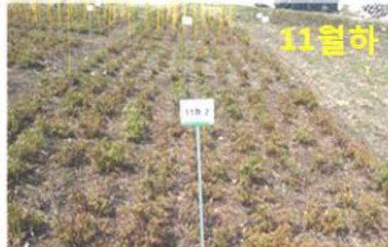
지상부 조기제거에 따른 이듬해 봄 생육양상