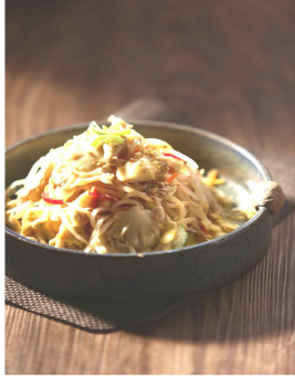
【 콩나물겨자채 】