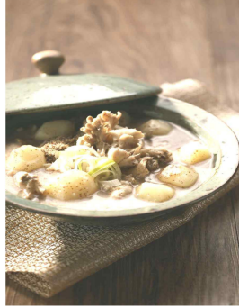
【 들깨탕 】