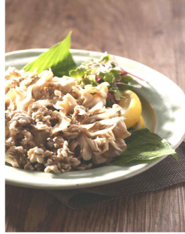
【 초회 】