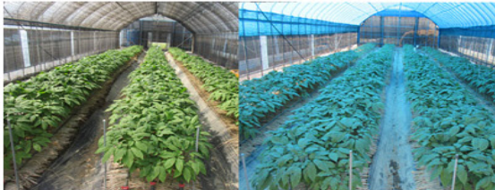
【지상부 생육(좌: 장수필름, 우: 청백양면 85%)】