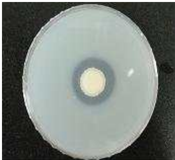
〈 효모 〉