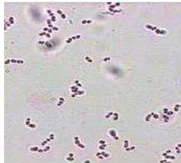
〈 유산균 〉