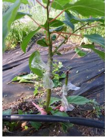
녹지 + 녹지