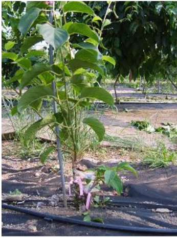
숙지 + 숙지