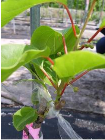
녹지 + 숙지