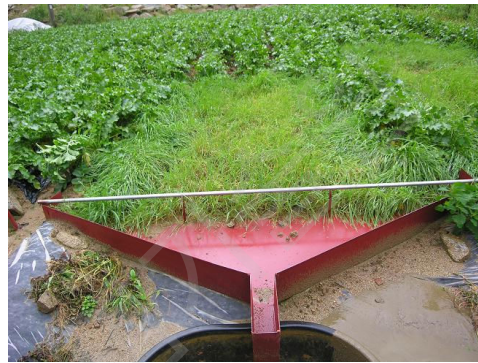
<처리 3m의 호맥 생육 상황>