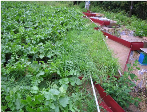
<처리 1m의 호맥 생육 상황>