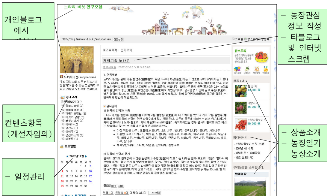
[그림 2] 개인 블로그 예시