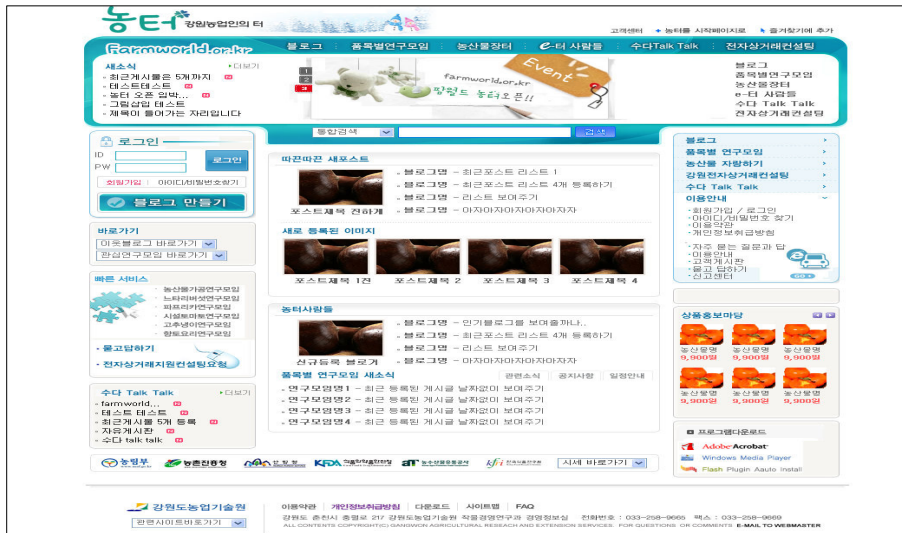
[그림 3] 통합 사이트