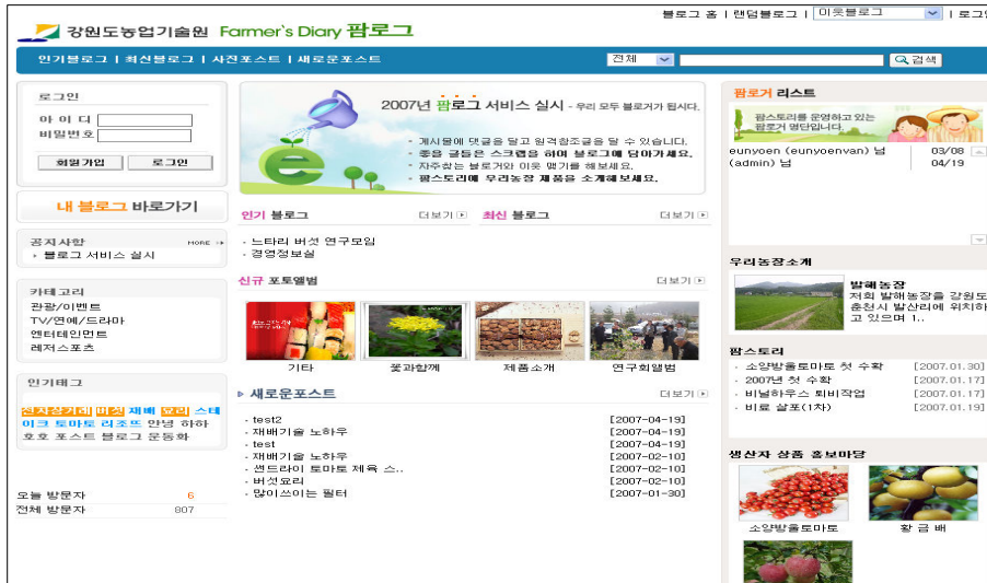
[그림 2] 블로그홈페이지