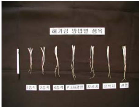
그림 6. 해가림 자재별 묘상생육상황 수