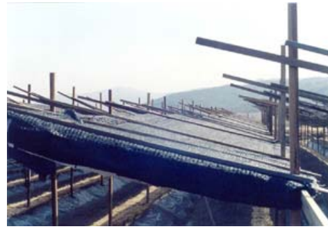
그림 8. 전주높이별 해가림 시설 설치

전주높이별 묘상의 월별 평균지온 변화는 광량이 많은 전주 180cm에서 높은 경향이었으며 상대적으로 전주높이가 낮은 온도가 낮은 경향을 보였다(표 16).