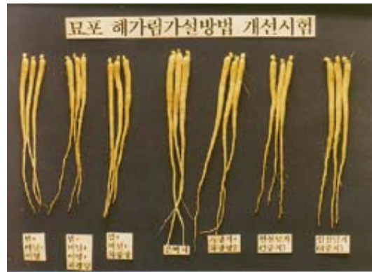
그림 4. 해가림 자재별 묘소질