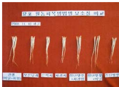
그림 2. 월동피복 자재별 묘상질