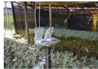
Hobo 설치 모습