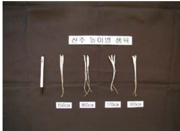
그림 10. 전주높이별 수확기 묘상의 묘소질

전주높이별 생육기간 중 고온일수는 150cm 40일, 160cm 47일, 170cm 53일, 180cm 52일로 전주높이가 높을수록 고온일수가 많은 경향이었다. 이는 전주높이가 높을수록 광량이 많아지기 때문인 것으로 생각된다.